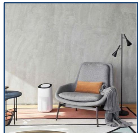
Lucci Air Maxi