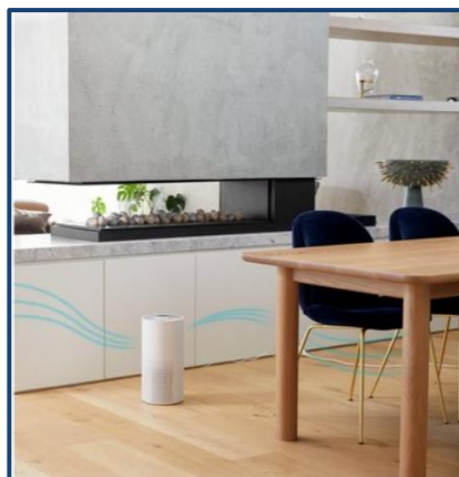
Lucci Air Volume